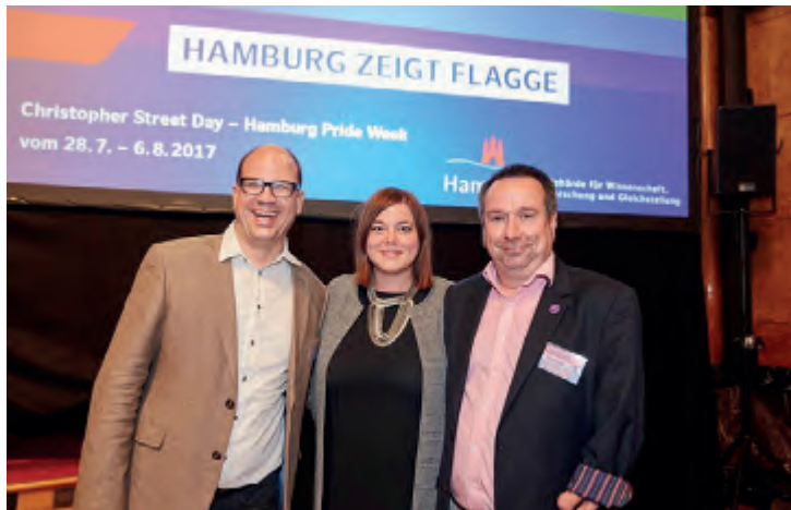
Bisexuelle zusammen mit Hamburgs Zweiter Bürgermeisterin Frau Fegebank