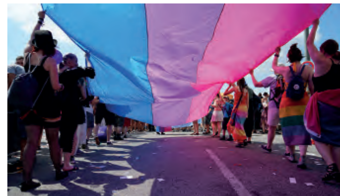
15m Bi-Flagge beim CSD.

Facebook/Twitter/Instagram/MeetUp: BiFriendsHH