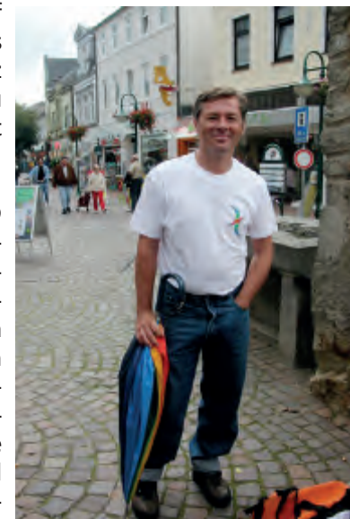
Neugründer des Stammtisches 2006

Mein zweiter Schritt war, auf dem Kieler CSD präsent zu sein. Die HAKI hatte mir freundlicherweise gestattet, Material an ihrem Stand auszuliegen und an ihrem Stand präsent zu sein. Lustigerweise wurde ich mit sehr offenen Armen vom CSD-Verein, von der HAKI und von vielen anderen begrüßt. Bisexuelle Menschen waren in Schleswig-Holstein schon eine Weile scheinbar ausgestorben, zumindest war dieses scheue Wild lange nicht in der Öffentlichkeit gesichtet worden. Toll war, dass doch ein mit einer Frau verheirateter Bi-Mann mit seinem Freund vorbeigeschaut hat und toll war auch, dass eine Frau von dem früheren Kieler Stammtisch hingekommen ist. (Mein erster